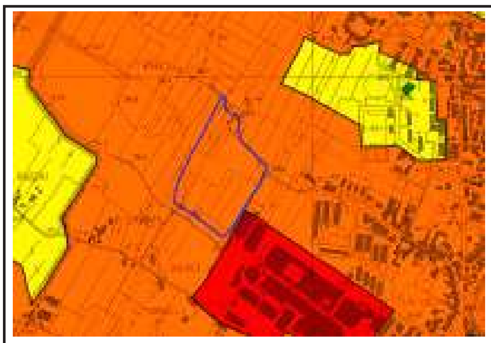
Sopra, il perimetro in blu identifica il lotto sul quale sorgerà il nuovo complesso produttivo-commerciale.

L'insediamento è accessibile dalla via Alfieri ricompreso fra la prosecuzione della stessa via Alfieri a sud e con accesso sulla nuova variante della via Barberinese ad ovest; è connessa a nord con la nuova rotonda di incrocio tra l'asse dell'industrie e la nuova variante della via Barberinese.